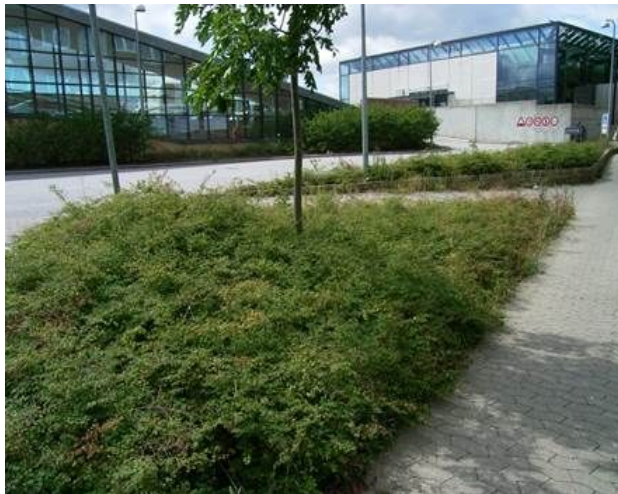
Rød snebær og pile-beplantning ved grussti ud mod søen